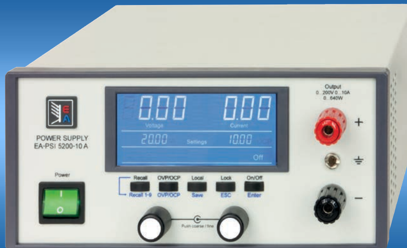
EA-PSI 5200-10 A

Programmierbare DC-Tischnetzgeräte Programmable desktop DC Power supplies